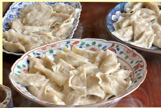
▲餃子もたくさん作りました!