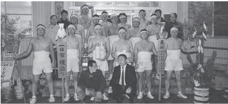
▲参加した青年男子達

彼らの参詣には八中生の受験合格や五穀豊穰、家内安全などの願いがこめられています。