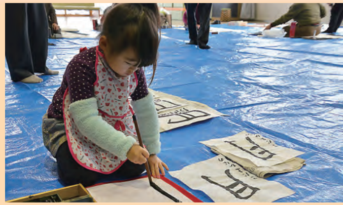
▲お手本を見ながら、ていねいに…

1月5日、はちパルで新春書き初め会が行われました。大人の部10名、児童・生徒の部6名が参加し、先生に指導を受けながら書に臨みました。今回の最年少参加者はなんと4歳!初めての書き初めはとつても上手にできました。作品は1月31日までにはちパルと北都銀行八郎潟支店に展示されました。