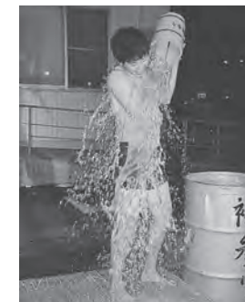
▲氷点下の気温の中、走者たちは冷水で水ごりをし、勇ましく町内を駆けました。

走者たちは、応援にかけつけた人たちに見守られながら、湖東消防八郎瀉分署と6つの神社を回りました。 現在の実行委員会では今年を最後の開催としており、来年以降の開催は未定です。