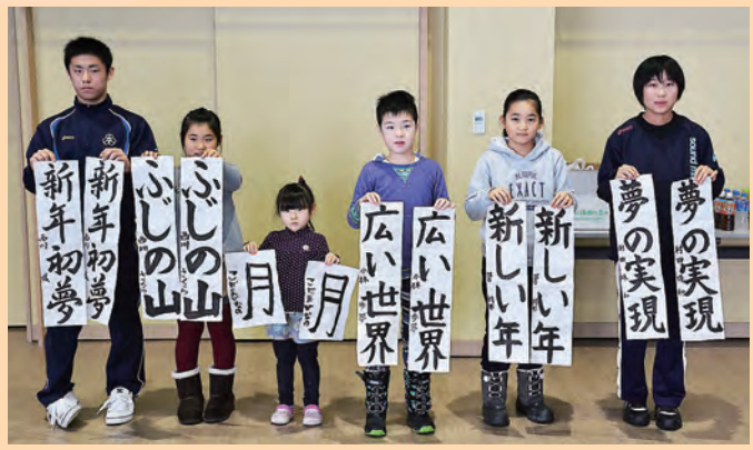
▲力作がズラリ。みなさん達筆ですね。