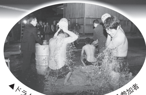
◀ドラム缶の薄水を割って水ごりする参加者