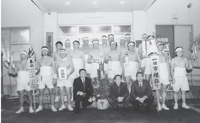
▲今年参加の青年男子達

1月1日午前零時——平成28年の幕開けと同時に行われた恒例の伝統行事「一日市裸参り」。今年は、青年男子総勢18名が参加しました。彼らの参詣には町内安全や五穀豊穰、家内安全、八中生の受験合格などの願いがこめられています。 参加者たちは、応援にかけつけた人たちに見守られながら、一日市に威勢のいい「ジヨヤサ！」の声を響かせ、5つの神社と湖東消防八郎潟分署を参拝しました。