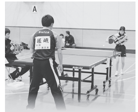
10/18 八郎瀨町卓球大会