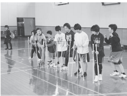
10/11 スポーツフェスティバル