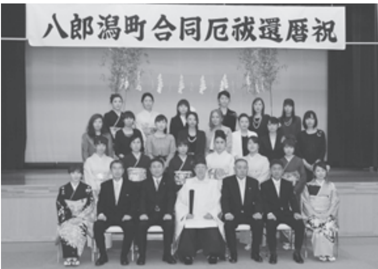
▲数え年で33歳を迎えられた22名のみなさん

2月7日、合同厄祓・還暦祝が農村環境改善センターで行われ、数え年で33歳の女性、42歳の男性、還暦を迎えられた方々、総勢144名のみなさんが参列しました。参列者のみなさんが神妙な面持ちで玉串奉奠などを行った後、畠