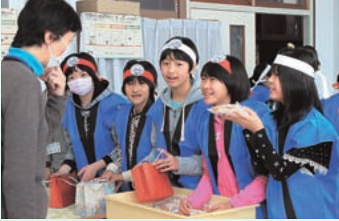
▲2月20日の授業参観で売り子体験をしました。

八郎湯小学校で3～6年生を対象に実施している総合的な学習の時間「八郎湯みらい学」。5年生は年間を通して「ふるさとの特産品を発信しよう」とい