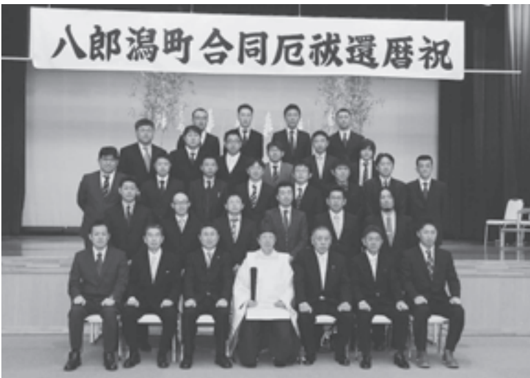
▲数え年で42歳を迎えられた26名のみなさん