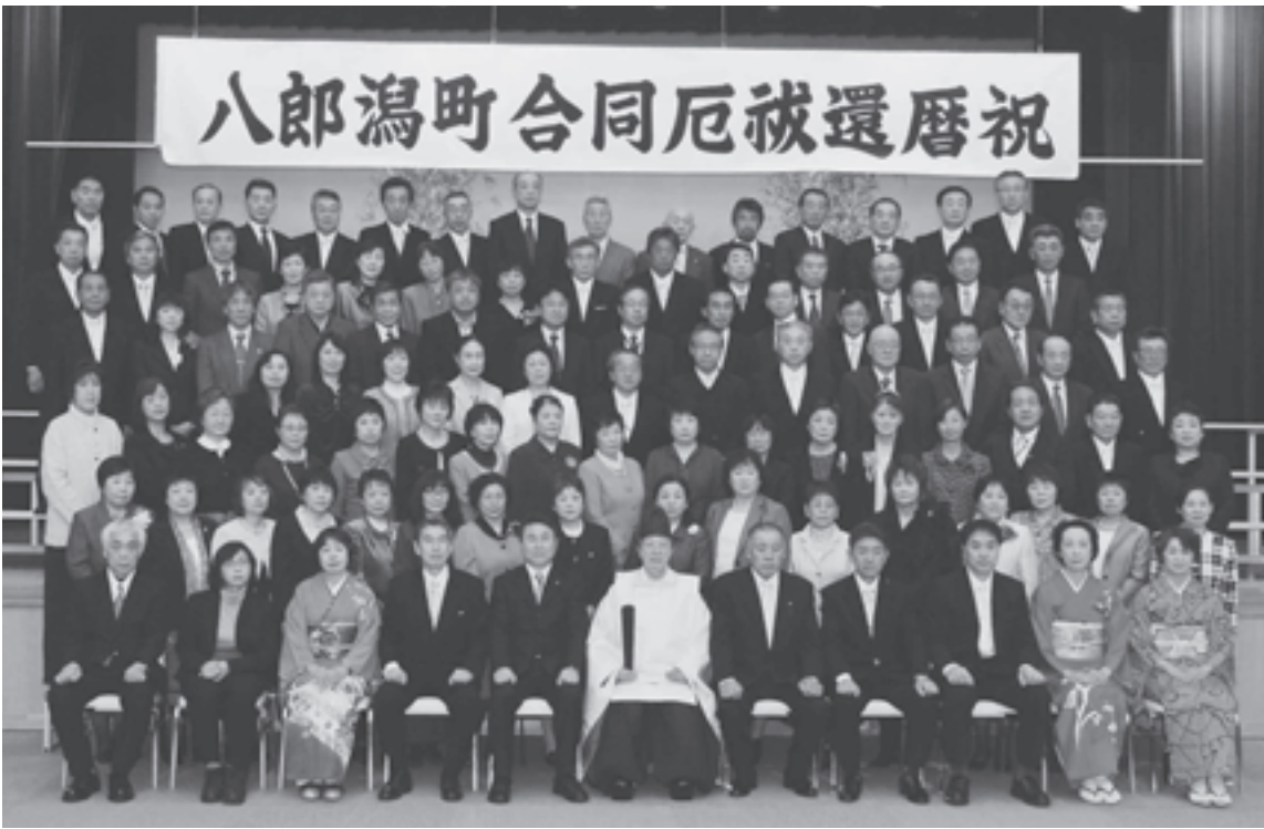
▲還暦を迎えられた96名のみなさん