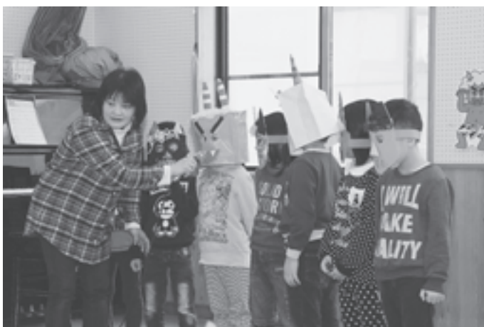
▲「ぼくの中にはおこりんぼう鬼と泣き虫鬼がいます」

2月3日、八郎潟保育園で豆まき会が行われました。園児たちは自ら鬼に扮し、自分の中に住んでいる鬼を発表しました。おこりんぼう鬼・朝起きれない鬼・はずかしがり鬼・好き嫌い鬼など、自分の中に住んでいる鬼を豆まきをして追い払いました。