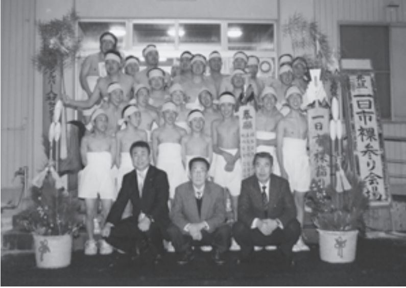
▲今年の勇気ある男たち。3年連続で走るとご利益があるとか…

1月1日午前零時——平成27年の幕開けと同時に行われた恒例の伝統行事「一日市裸参り」。今年は、中学生11名を含む総勢27名が参加しました。彼らの参詣には八中生の受験合格や五穀豊穰、家内安全などの願いがこめられています。 走者たちは、応援にかけつけた人たちに見守られながら、一日市に威勢のいい「ジヨヤサ！」の声を響かせ、湖東消防八郎潟分署と5つの神社を回りました。