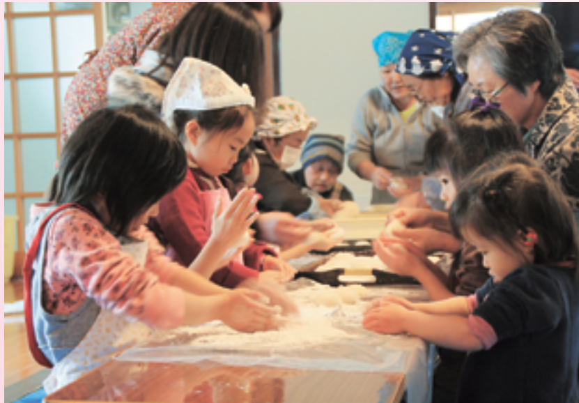
▶お寺の中ではお母さんたちと子どもたちがつき終わった餅を丸め、味付けをしました。みんな真剣な表情です。

作の蒸し設備で餅米を蒸し、子どもたちも交じって力いっぱい餅をつきました。用意された餅米60kgはすべて檀家さんからの寄付だそうです。餅つきのあとは、きなこやごまあんこなどの衣をまとったつきたての餅とあたたかい豚汁をみんなで囲んでいただきました。