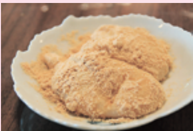
▼つくたてふわふわのきなこもち

作の蒸し設備で餅米を蒸し、子どもたちも交じって力いっぱい餅をつきました。用意された餅米60kgはすべて檀家さんからの寄付だそうです。餅つきのあとは、きなこやごまあんこなどの衣をまとったつきたての餅とあたたかい豚汁をみんなで囲んでいただきました。