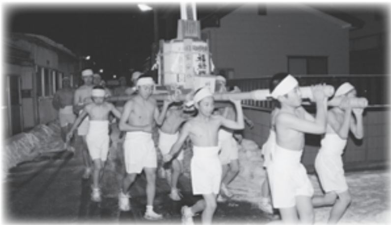
▲後半戦に入ってもまだまだ元気！