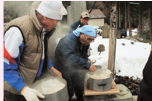
▲お父さんたちによる自作の蒸し設備で餅米を蒸します。

企画したこの餅つき大会は、昨年に初めて開催され、今回で2回目の開催です。当日は50名ほどが参加。まきストーブやドラム缶を使った自