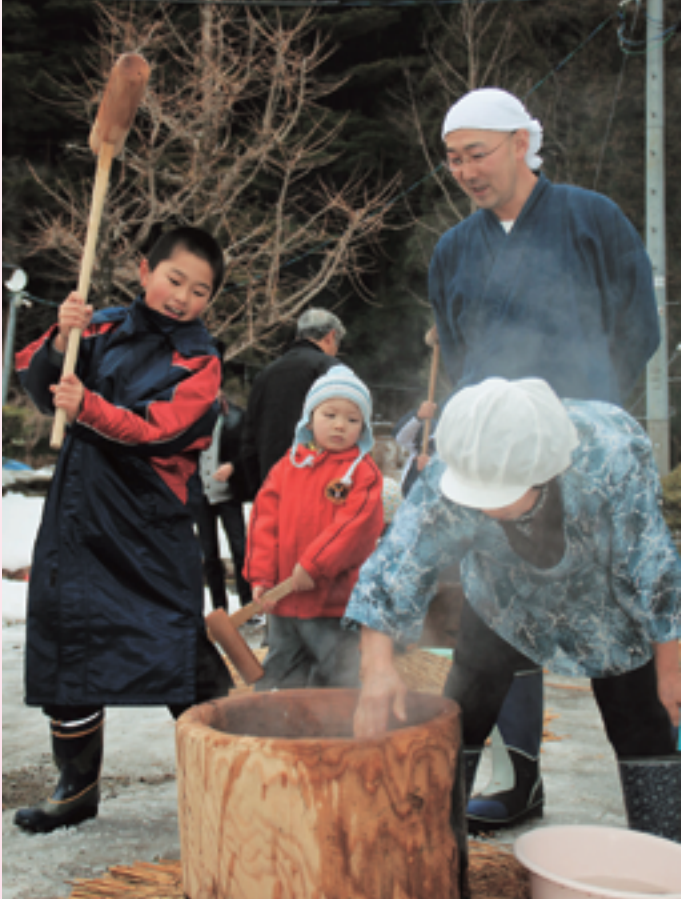
▲威勢よく餅をつく子どもたち。立ち上る湯気で寒さがうかがえます。