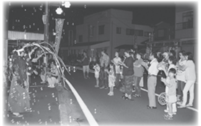
▲3日間行われた、八郎湯町大道演芸倶楽部による大道芸