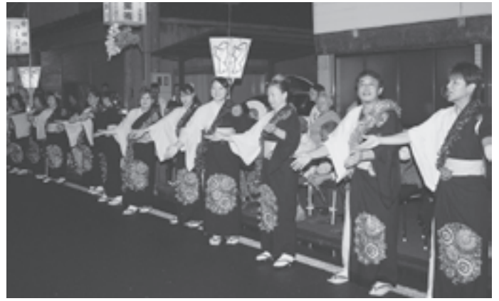
▲社会福祉法人 榮寿苑福祉会