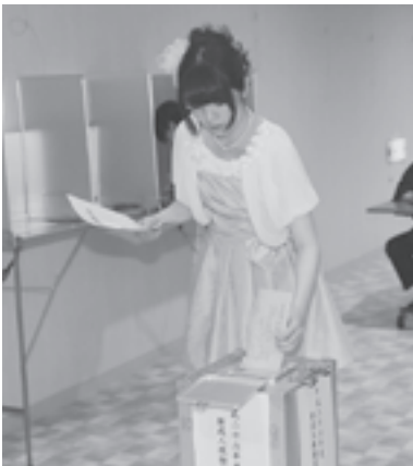
▲模擬投票を行いました

また、新成人の自主運営による同期会が開かれ、久しぶりに集まった同期生たちとの会話に花を咲かせていました。