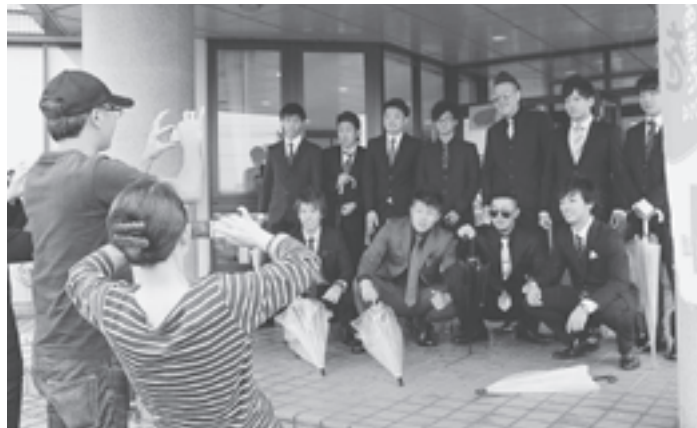
▲ピシッとキメて記念撮影