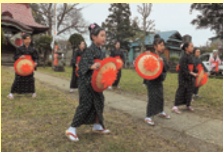
▲今戸子ども民謡手踊り (秋田県井川町)