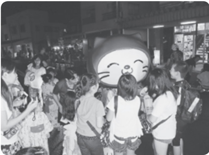
▲ニャンパチも登場しました！