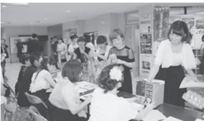
◀ 久々の再会でにぎわう受付