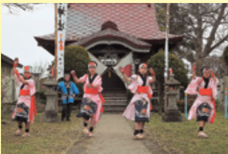
▲今戸子ども願人踊り (秋田県井川町)