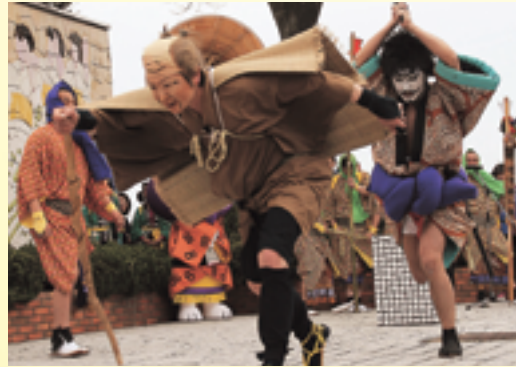
▲願人踊り (秋田県八郎湯町)

先月号では、願人坊主は傘(か)らかさ)1本を持って「伊勢音頭」や「住吉踊り」、「かっぽれ」などを歌い踊って米銭を乞い、全国各地で放浪の旅を続けていたこと。彼らが伝えた芸が通称「願人踊り」と呼ばれていること。 「願人坊主が伝えた民俗芸能の祭典」には、県外から3団体が出演することなどをお知らせしました。今月号では、県内の出演団体(出演演目)についてお知らせします。