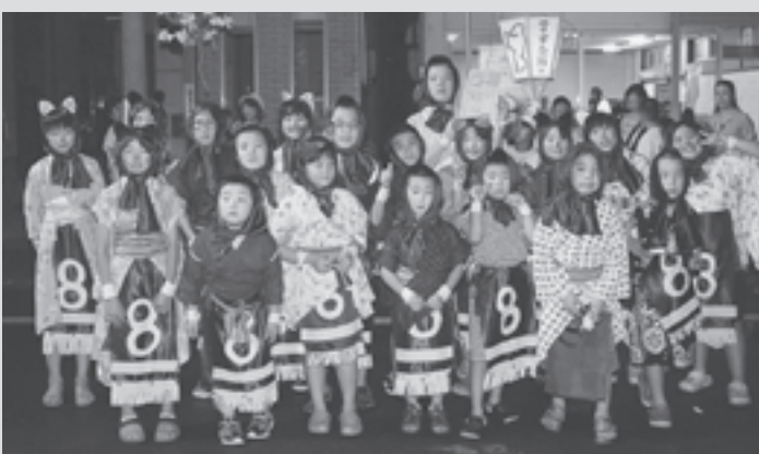
▲最優秀賞の4・5・6区子ども会