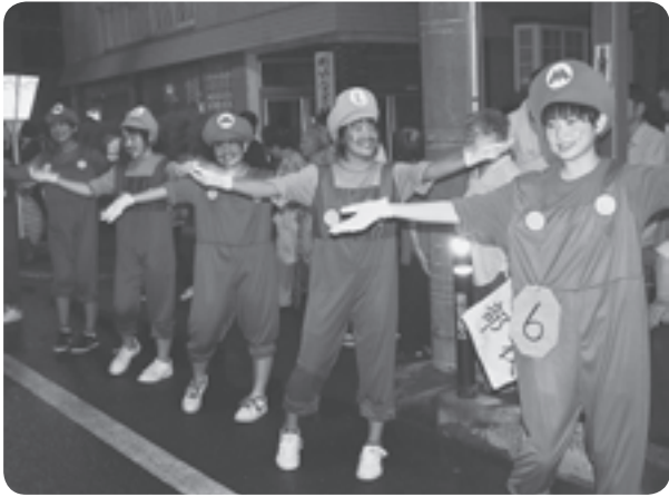
▲八郎湯中学校女子バスケットボール部