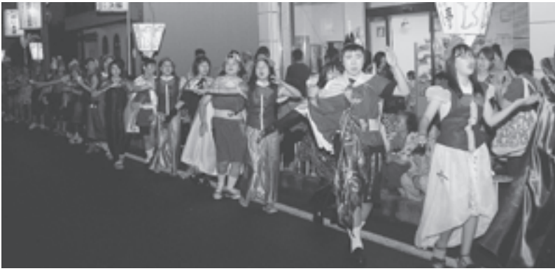
▲八郎潟中学校吹奏楽部

秋田県三大盆踊りの一つ、一日市盆踊りが8月18日～20日の3日間、一日市上町大通りに於いて盛大に開催されました。3日間で約1,000人の踊り手が参加、約10,000人もの方にご来場いただきました。今年は3日間とも仮装の審査が行われ、連日色とりどりの仮装踊りでにぎわいました。