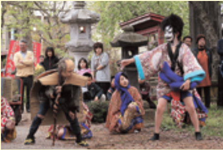
▲子ども願人踊り (秋田県八郎湯町)