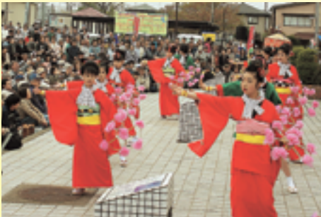
▲秋田音頭 (秋田県八郎湯町)