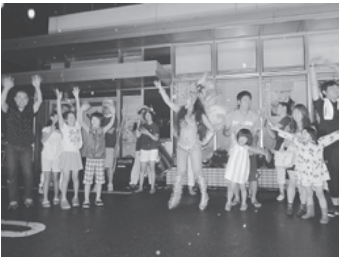
▲8月17日、北都銀行前で一日市盆踊り前夜祭が開催され、フォークソングステージや各種ダンスで会場を沸かせました。