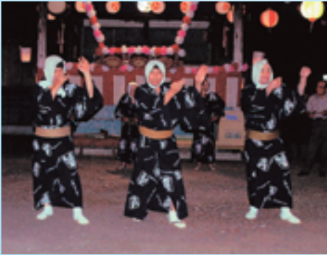
▲駒衣の伊勢音頭 (埼玉県美里町)