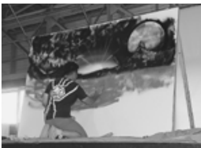
◀ GOMAさんによるスプレーアート