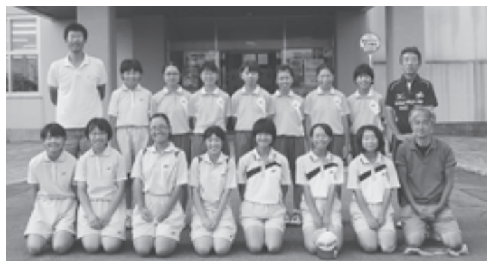
▲女子ソフトテニス部全県準優勝