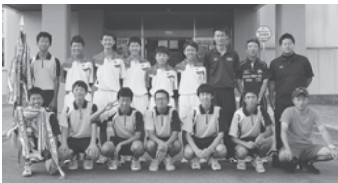
▲男子ソフトテニス部全県優勝