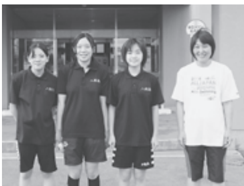
▲水泳部のみなさん