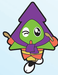
秋田県マスコット「スギッチ」