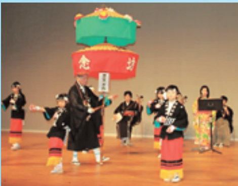
▲願念坊踊 (富山県小矢部市)

「住吉踊」、 「かつぼ れ」などを 歌い踊って 米銭を乞い、 全国各地で 旅を続けて いたようで す。彼らが 伝えた芸が 通称「願人 踊」と呼ばれ、その土地の祭りや 民俗と結びつき、時代と共に変化 しながら現在まで傳承されていま す。 「願人坊主が伝えた民俗芸能の 祭典」には、県内外5つの民俗芸 能の保存団体が8つの演目を披露 することになっています。 県外からの出演は、①富山県小 矢部市の市指定無形民俗文化財 「願念坊踊」、②埼玉県美里町の 「駒衣の伊勢音頭」、③宮城県登米市の市指 定無形民俗文化財「小島願人踊」 の3団体です。 そのうち宮城県登米市の「小島 願人踊」は、江戸時代末期に、登 米市小島地区に滞在した願人坊主 が伝えたもので、五穀豊穡を祈願 する踊りとして演じられてきまし た。その後、座敷芸へと変遷し、 現在は酒席の余興芸として「甚句 (じんく)」などとともに踊り継 がれている芸能です。 この「小島願人踊」は、全国青 年大会郷土芸能の部で日本一にな り、アメリカカリフォルニア州の デイズニールランドでの公演を果た した注目の演目です。 (来月号に続く)