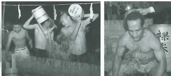
出発前の水ごり。体を清める勇士たち。

年が明けると同時に行われている恒例の伝統行事「一日市裸参り」。今年も新たな勇士を迎え、中学生18名を含む総勢35名が集いました。 今年の裸参りは、御幣と御輿のほか、宮城県気仙沼市の漁船に飾られていた大漁旗2本を担いで神社など6カ所を巡りました。この大漁旗には被災地のいち早い復興を祈って、小中学生を始め、一般の方にも復興祈願の寄せ書きをしていただきました。 当日は、寒さが厳しく時折吹雪く時もありましたが、全体的に穏やかな天候。薄氷の張る中、水ごりを開始し、年が明けると同時に「ジョヤサ！」の掛け声で参加者たちは、約5キロの道のりを無事走破しました。