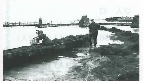
▲モグ採り船