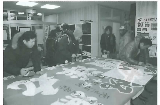
当日の防災センターには大漁旗に寄せ書きしようがたくさんの方が訪れていました。