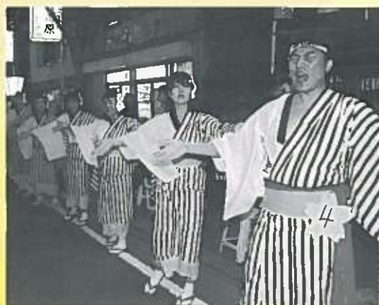
一般団体の部で優勝した 榮寿苑の皆さん