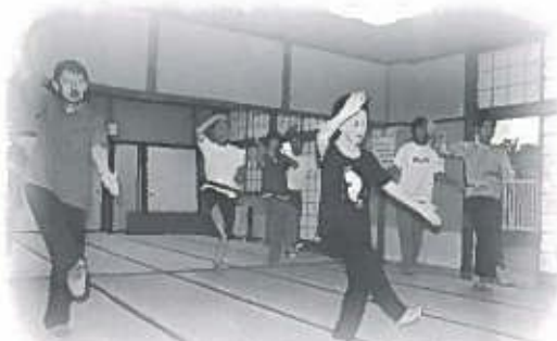
盆踊り講習会も好評でした