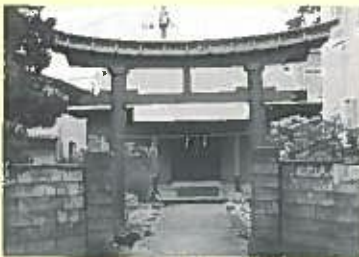
永覚町神社 五郎盛季の像は中

夜明けの中で、若殿三浦五郎盛季の奮戦はものすごく、敵はたじたじとなり、後退し始めた。これを見た三浦家家臣で