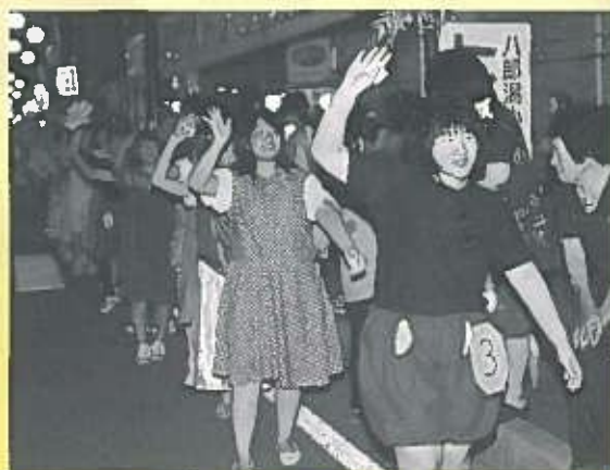
中学生団体の部で優勝した 八中吹奏楽部の皆さん