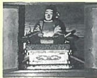
土崎永覚町の三浦五郎盛季の座像

永覚町界隈の人たちはこれを哀れんだ。五郎盛季の祠を造り懇ろに弔い、現在に至っている。一日市清源寺の、三浦五郎盛季の若宮八幡宮座像とはよく似ている。（以後関連の研究が必要）