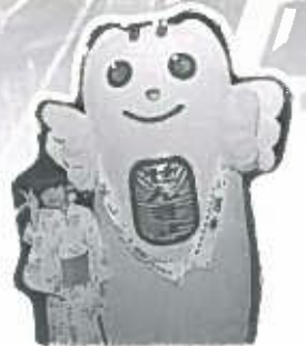
明るい選挙キャラクターのめいすいくんも盆踊り会場に遊びにきました

競演会へは、3日間で述べ1,144人の踊り手が参加。その他にも飛び入り参加の踊り手も多数踊りの輪に加わり、「踊る踊り」といわれる一日市盆踊りの名にふさわしい踊りの輪が会場いっぱいになりました。