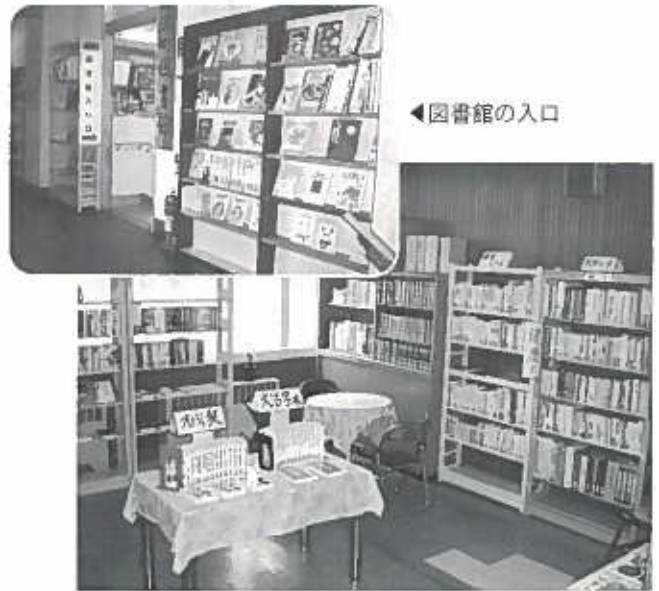
▲館内は少しずつ変化しています

開館時間は午前8時30分～午後4時30分まで 貸出冊数 1人5冊まで 期間は2週間です