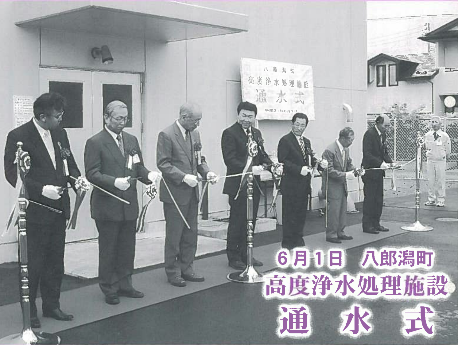
6月1日 八郎潟町 高度浄水処理施設 通水式