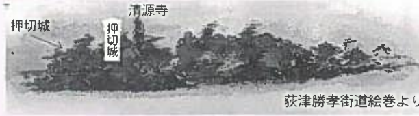
荻津勝孝街道絵巻より