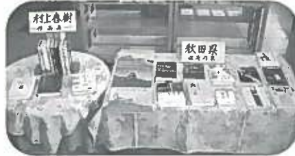
▲ミニコーナーです