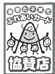
②協賛店ステッカー

「あきた子育てふれあいカードWebサイト」 http://common.pref.akita.lg.jp/k-yutai/