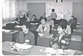
5月19日(火)には県立図書館と日本銀行秋田支店を視察研修に行ってきました。