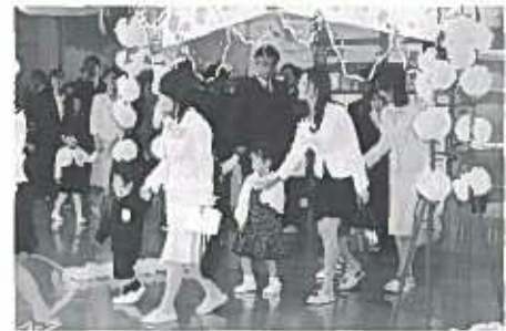
元気いっぱいに入場