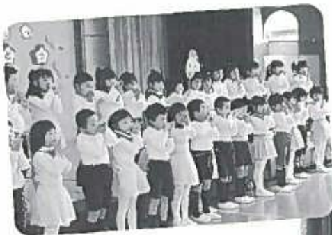
ドキドキ!! ワクワク!!