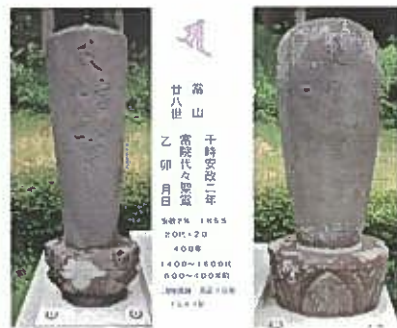
※現在は、五城目町にあります。

10年ほど前まで、尼子館の麓の墳墓に2基あり、当山28世等の刻印から戦国の乱世(湊合戦)に係わりがあると思う。