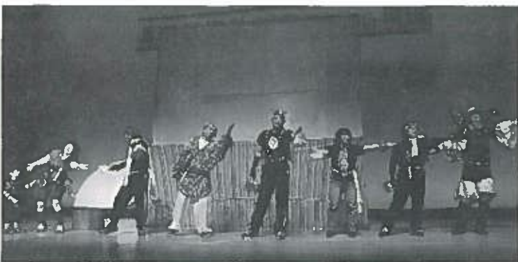
盆踊りサミットで上演した路上ミュージカルの皆さん