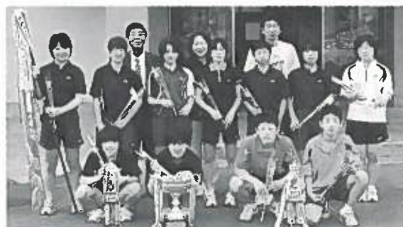
バドミントン同好会の皆さん