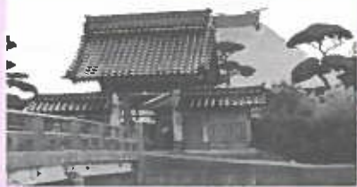
川の前、圓福寺 大久保

潟上市大久保の圓福寺の由来は興味深い。(千田軍記や秋田軍記には見られない記述である) 四年ほど前に潟上市(旧昭和町)の老人クラブから講演依頼があったので、潟上市(旧昭和町)の取材をしていた折り、圓福寺を訪問し大和尚様のお寺の縁起について聞くことが出来た。説明版にも書かれている。