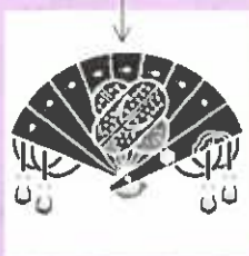
榎山家家紋 榎扇鷹二羽重