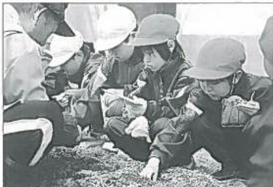
八郎湯小学校の2年生