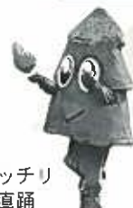
スギッチが 願人踊