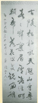
▲七言絶句。南朝の吞むた藤に佇立する老僧の南朝への哀情を詠じたもの。天皇が流刑、崩御された隠岐の山寺の舞台であろうか。藤深筆。(19区一小玉 薫さん・所蔵)

まもなく足利高(尊)氏の謀反により、吉野に 遷幸。南朝は成立したものの、失意の間に崩壊さ れた。鎌倉幕府の大軍の攻撃で、天皇を慕う楠木 正成の赤坂城もケチられ、天皇は捕われた。 右の唱歌は、楠木正成・正行の父子が別離の最 後となった「桜井の駅」のシーンである。