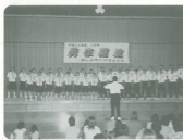
▲最優秀賞を目指し熱唱中