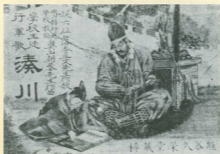
落合 直文・作詞 奥山朝恭・作曲「桜井の訣別」

北畠親房が「神皇正統記」を著作した一三 四三年以来、戦場の昭和20年まで、日本は、 南朝正統論の立場を踏まえて、国定教科書で 指導してきたのであった。