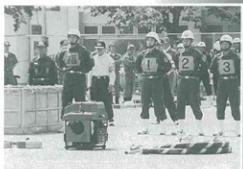
▲競技に取り組む第5分団員

7月25日に飯田川町で開催された男鹿南秋支部消防操法大会へ出場した第5分団は、借しくも2位となり県大会への出場はなりませんでしたが、来年の活躍を期待します。