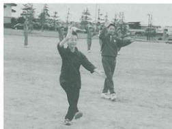
▶一日市盆踊りの講習を受ける八中生徒

八郎潟中学校では、7月15日午後全校で中学校グラウンドにおいて一日市盆踊り講習会を行ないました。当日は、講師に一日市郷土芸術研究会会長や4名の盆踊りの先生の指導のもと、約1時間20分にわたり、大きな輪になって太鼓、笛、唄に合わせて本番に向けて真剣に練習に励んでおりました。