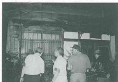
▲パトロールする皆さん

当日は、警察官の指導のもとに町内を巡回。施錠や危険箇所などを点検しました。なかには崩落寸前の危険がある廃屋などもありました。