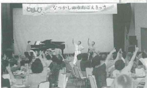
▲みんなで楽しく歌いましょう

みんなが主役となり、この地 域が活気づくことを願ってまた の再会を約束していました。