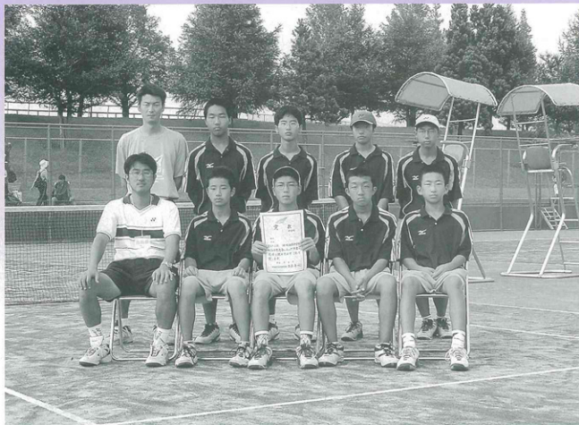
全県大会団体準優勝 男子ソフトテニス部（東北大会出場）