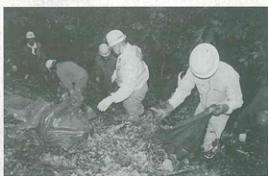
▲ボランティアを行う会員の皆さん