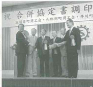
▲3町商工会長と3町長の固い握手

今後、合併に向けてさまざま な話し合いが行われますが、3 町商工会の合併の期日は、平成 17年4月1日としております。