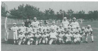
▲優勝した八郎潟町スポーツ少年団の皆さん

第3回南秋郡野球スポーツ少年団交流大会が7月17、18、24日の3日間元木山球場と大潟村民球場で開催され、八郎潟町野球スポーツ少年団は決勝戦で井川町野球スポーツ少年団を相手に8対5で勝利見事優勝に輝きました。