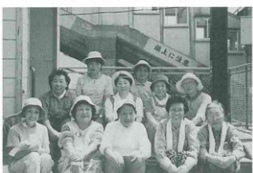
▲清掃活動を行った婦人会会員の皆さん

ふれあいロードには、今までにも落書きなどのいたずらが多くありました。今も汚れがあることから8月の帰省客が多くなる前に婦人会員11名が参加して猛暑の中、窓ガラスや通路などの清掃活動を行いました。