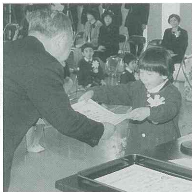
▲大きな返事で、園長先生から修了証書をもらいました。(幼)