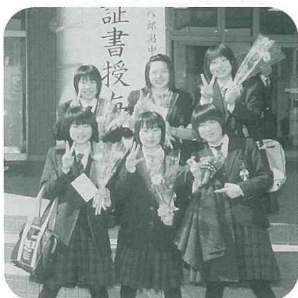
▲3年間頑張りました。と〜ってもいい笑顔です♪(中)