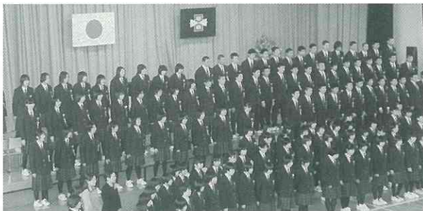
▲全員で歌うのはこれが最後。「大いなる秋田」の大合唱。(中)