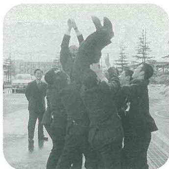
▲お世話になった恩師を胸上げして恩返し。(中)