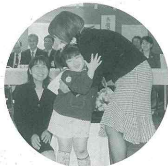
▲「おめでとう」。お母さんにやさしく抱きしめられて、ご満悦(˘-˘)。(幼)