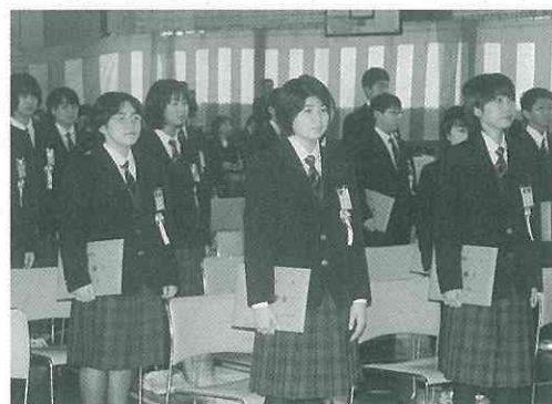
▲制服姿もバッチリ決まっています！気分は中学生。(小)