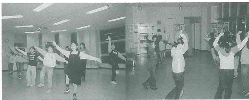
▲子どもたちもお祭りに向けて猛特訓中!!

5月5日こどもの日は、恒例の一日市神社祭典です。秋田県無形民俗文化財の一日市願人踊が練り歩き、秋田音頭の牽き山車が町内を回ります。 リズムカルな一直踊りとコミカルな寸劇の一日市願人踊、優雅で美しい秋田音頭をぜひご覧ください。