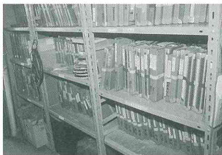
▲教材については、図書館・公民館にあります。