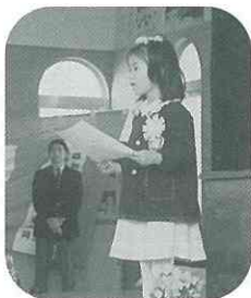
▲一人ひとりが幼稚園での思い出を述べました。(幼)