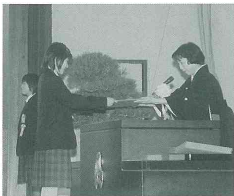
▲一人ひとりに修了証書が手渡されました。(小)