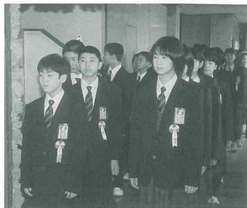
▲真新しい制服に袖を通した卒業生が入場。(小)