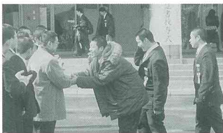
▲「先生、お世話になりました」(中)