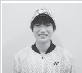
女子ソフトテニス部

ソフトテニス秋田県代表選手団に、八郎瀧中学校ソフトテニス部から3名の選手が選出されました。選手の皆さんは来年開催される東北6県対抗中学生インドアソフトテニス大会（2月）及び都道府県対抗全日本中学生大会（3月）へと出場予定です。