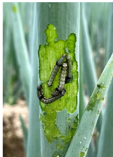
図-6 ハスモンヨトウ中齢幼虫によるねぎの食害