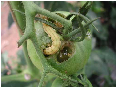
図-3 オオタバコガによるトマトの食害