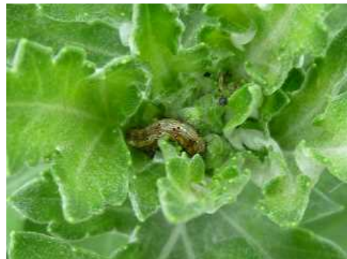
図-4 オオタバコガによるきくの食害