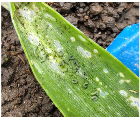
図-5 シロイチモジヨトウ若齢幼虫の群生（ねぎ）