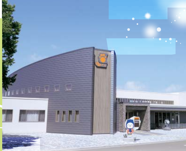
八郎瀧町えきまえ交流館