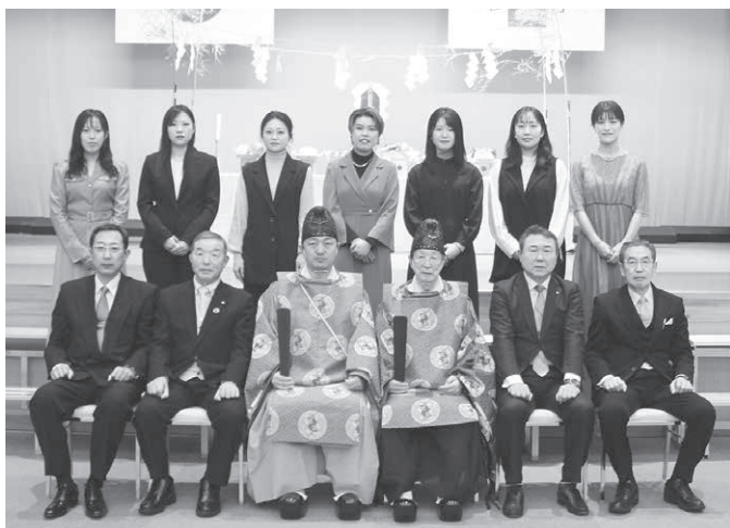
数え年33歳の皆さま