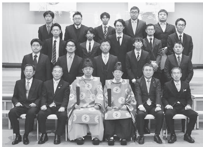
数え年42歳の皆さま