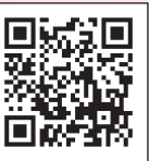
▶地域再生大賞についてはこちら

大賞の受賞とはなりませんでしたが、全国規模の賞で評価されたことで、今後の活動にさらに期待が膨らむものとなりました。